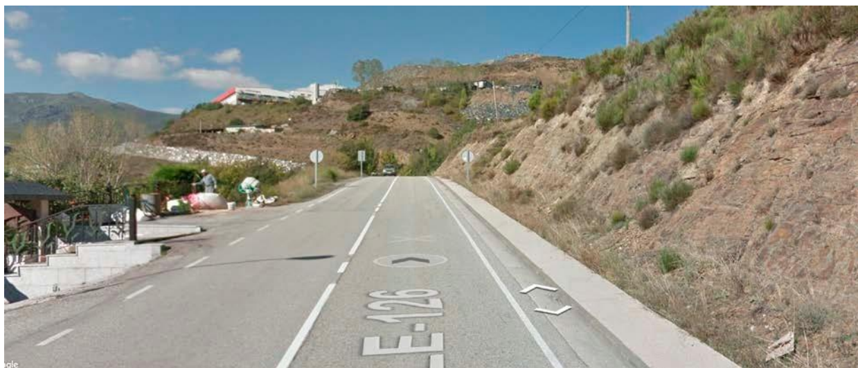
SALIDA. Km. 55,700. LE-126 Frente a la última casa saliendo de La Baña

6.6.4 El conductor del coche 0 deberá estar en posesión de alguna licencia federativa en vigor.