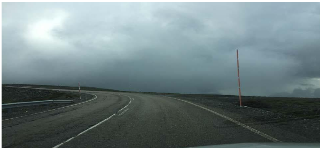
META. Km. 64,500. LE-126